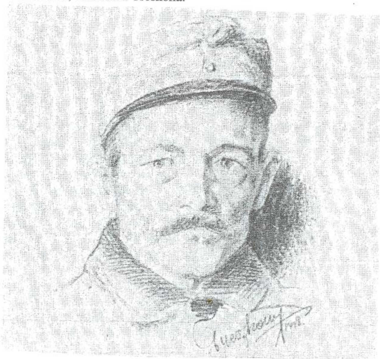
2. Vojak, kresba tužkou, 1918