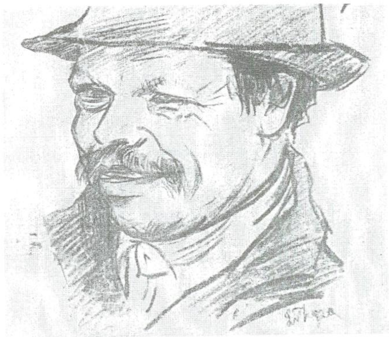
13. Michalko z Kotešovej, kresba kriedou, 1920