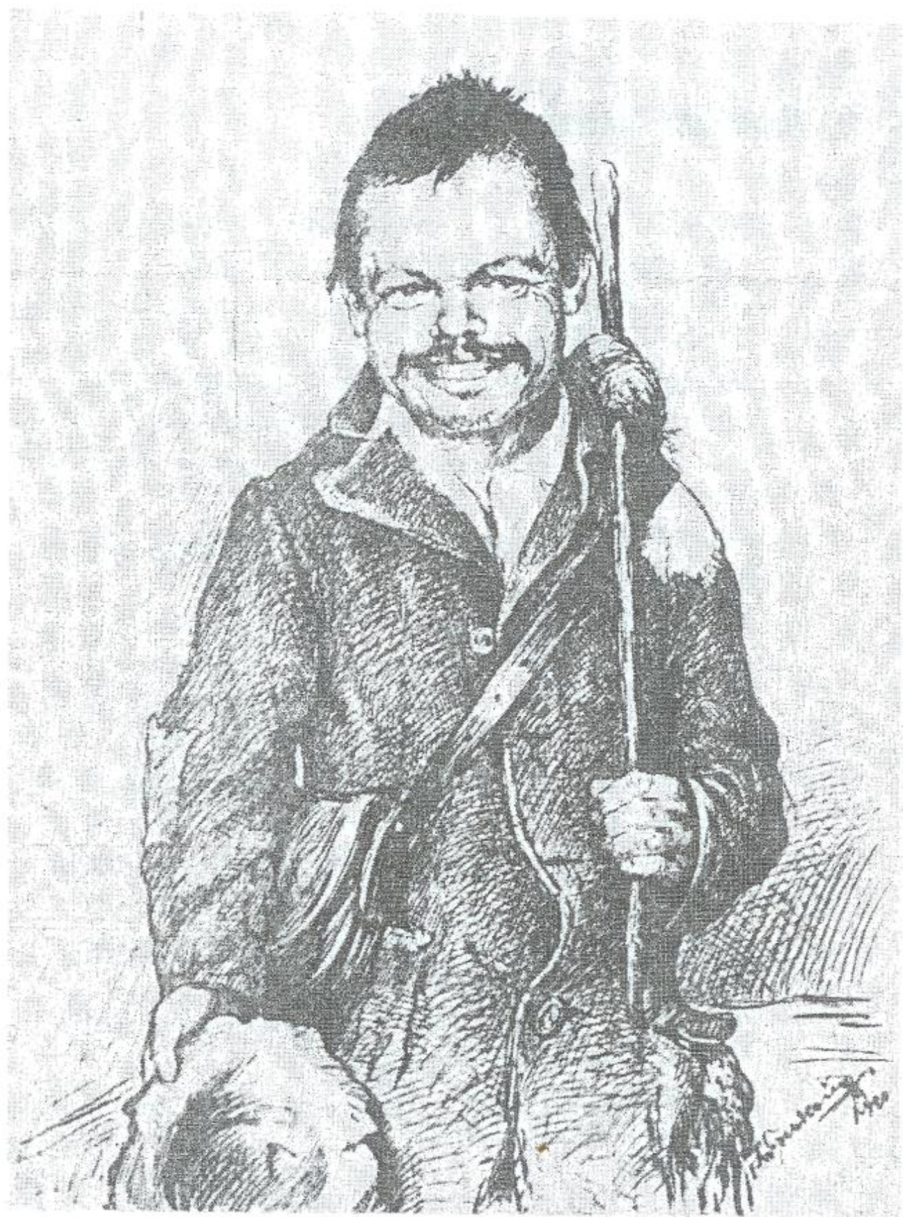
50. Žobrák z Kotešovej, perokresba a tužka, 1920