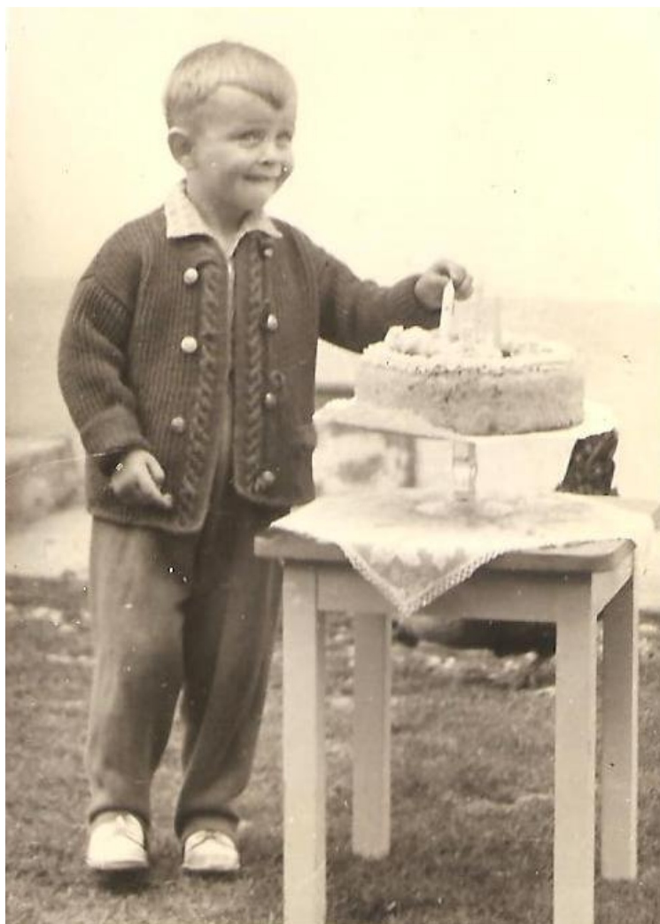
... oslava 3. narodenín