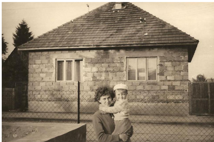
... s mamou (r. 1963)