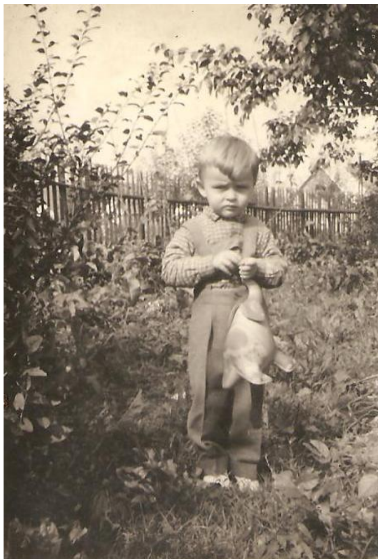
... s oblíbenou hračkou