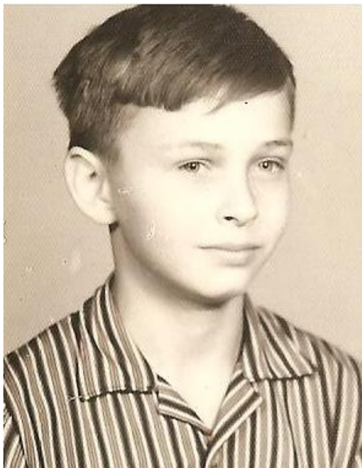
... žiak základnej školy