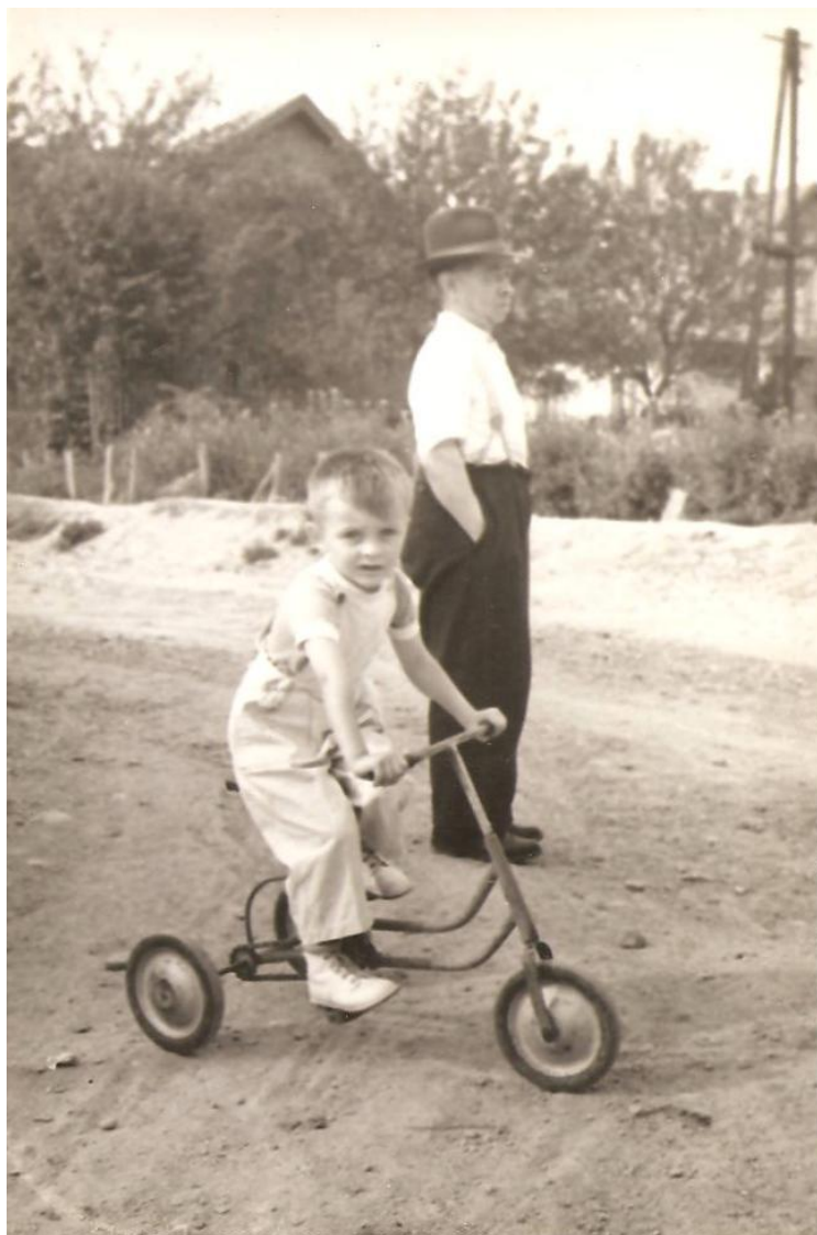
... s dedkom z Hliníka