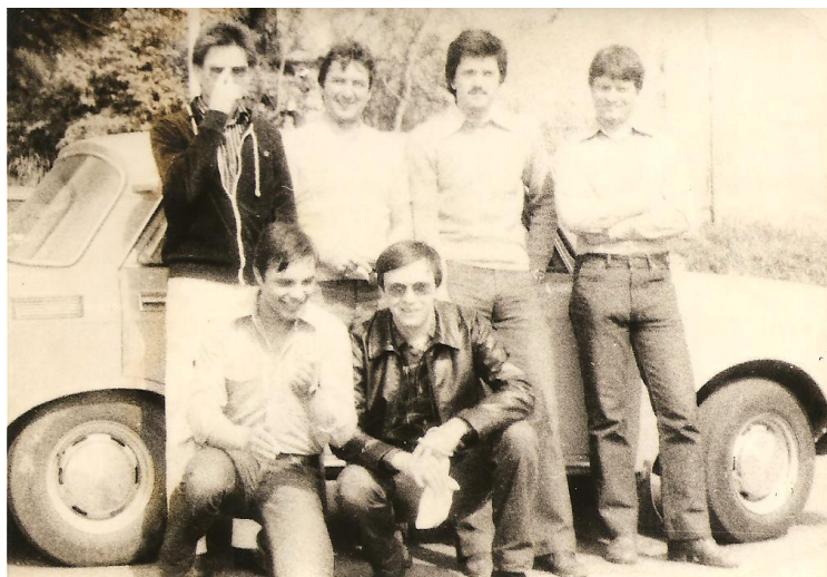
... s kamarátmi z Bratislavy