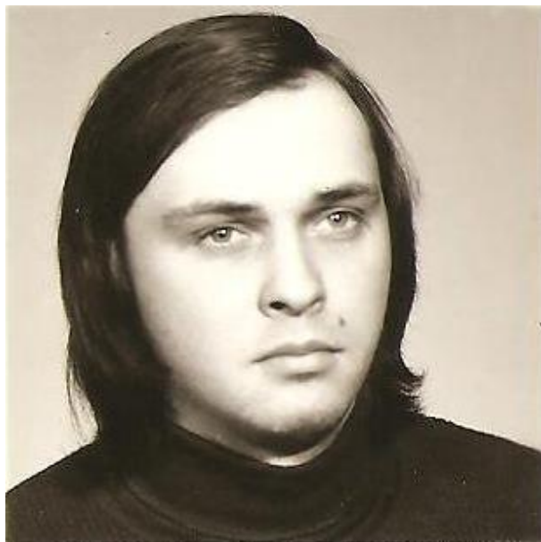
... pred vojenčinou