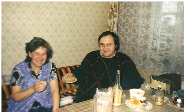
... s mamou (r. 2000)