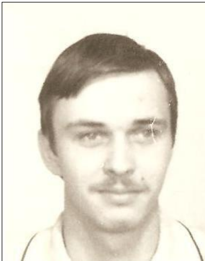
... v službách vlasti (r. 1979)